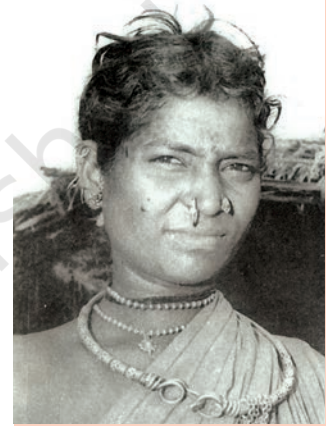
चित्र 5 गोंड महिला

इन राज्यों की प्रशासनिक व्यवस्था केंद्रीकृत हो रही थी। राज्य, गढ़ों में विभाजित थे। हर गढ़ किसी खास गोंड कुल के नियंत्रण में था। ये पुनः चौरासी गाँवों की इकाइयों में विभाजित होते थे, जिन्हें चौरासी कहा