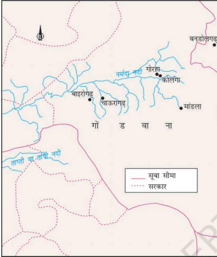
मानचित्र 2 गोंडवाना

दलपत की मृत्यु कम उम्र में ही हो गई। रानी दुर्गावती बहुत योग्य थी और उसने अपने पाँच साल के पुत्र बीर नारायण के नाम पर शासन की कमान संभाली। उसके समय में राज्य का और अधिक विस्तार हुआ। 1565 में आसिफ़ खान के नेतृत्व में मुग़ल सेनाओं ने गढ़ कटंगा पर हमला किया। रानी दुर्गावती ने इसका जम कर सामना किया। उसकी हार हुई और उसने समर्पण