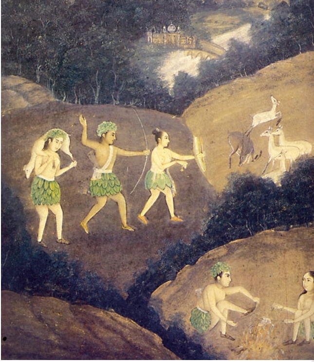
चित्र 2 रात में भील लोग हिरन का शिकार कर रहे हैं।